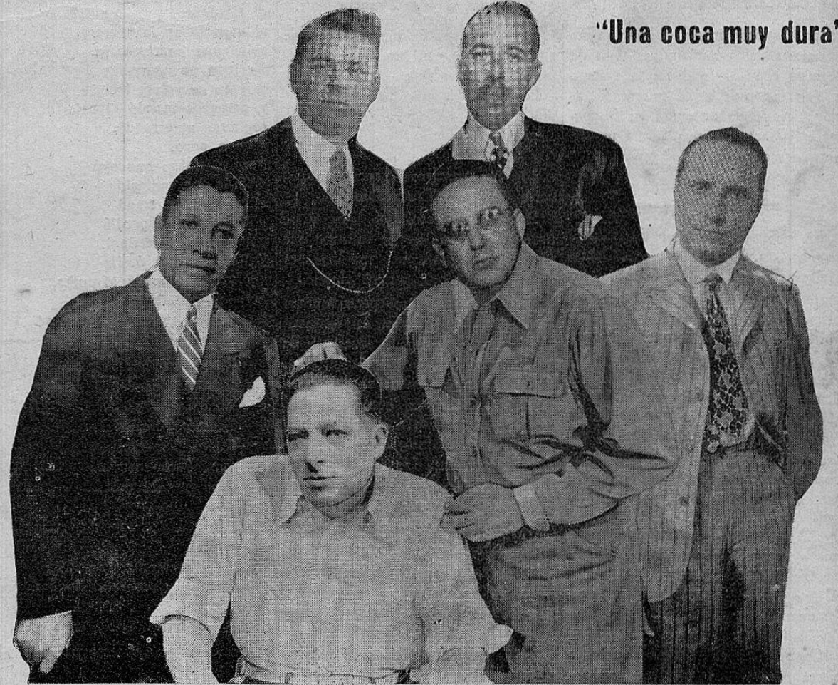
"Una coca muy dura"

Cartago, y esto, a pagarle una promesa a la Virgen de los Angeles. Eso fue en 1800. Después no ha vuelto y por una razón: se hizo comunista. Es moscovita por los cuatro costados y si lo dejan le mete fuego a los santos y a las iglesias. Como buen partidario de Stalin, dice que a los curas hay que quemar-